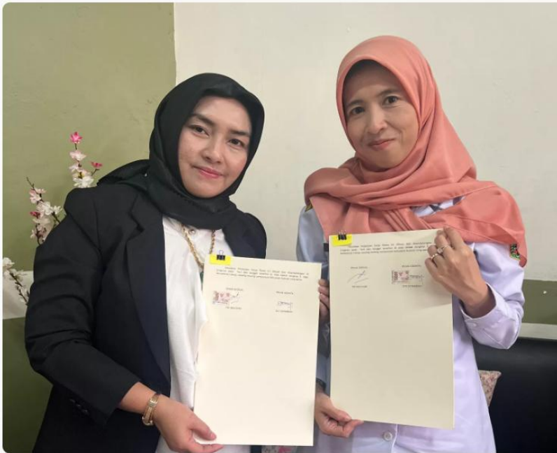
BKBH FH USM &dash; Pemkab Semarang Jalin Kerja Sama .

SEMARANG (sigijateng.id) – Biro Konsultasi Bantuan Hukum (BKBH) Fakultas Hukum Universitas Semarang (USM) menjalin kerja sama dengan Pemerintah Kabupaten Semarang dalam bidang Penyelenggaraan Pemberian Bantuan Hukum Gratis bagi Warga Miskin dan/atau Tidak Mampu di Kabupaten Semarang.